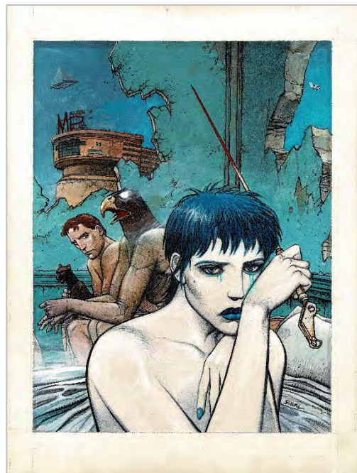
Enki Bilal (dibujo) y Pierre Christin (guion). «La femme piège», Nikopol , vol. 2, portada, Dargaud. 1986. Colección particular