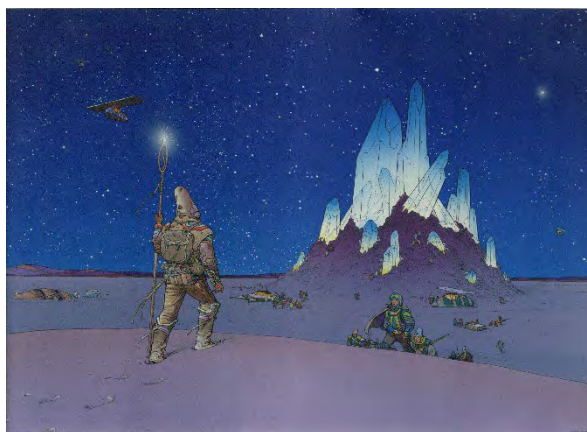
Jean Giraud, Moebius. Cristal Majeur . Ilustración, 1985. Tinta china y acrílico sobre papel. 9e Art Références, París

La muestra incluye obras de algunos de los personajes o cómics más célebres, como The Yellow Kid , de Richard Felton Outcault; Little Nemo in Slumberland , de Winsor McCay ; Terry y los piratas , de Milton Caniff; Tintin , de Hergé ; Flash Gordon , de Alex Raymond ; The Spirit , de Will Eisner ; Sin City , de Frank Miller ;