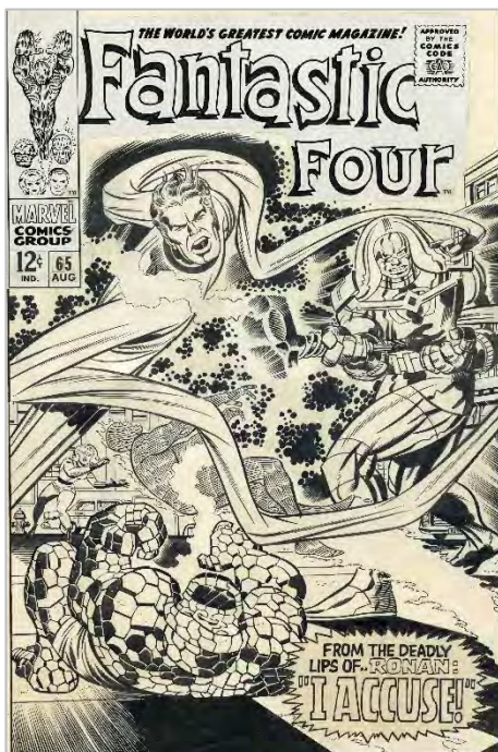
Jack Kirby. «From Beyond This Planet Earth!», Fantastic Four , n.º 65, portada, Marvel. 1967. Tinta china sobre papel. Colección particular

El cómic cuenta hoy con un alcance comunicativo que difícilmente puede lograr otro medio de expresión. Sin embargo, durante décadas su valor cultural y artístico no fue reconocido. De forma paulatina se ha consolidado como una forma de expresión que, emparentada con otras como la literatura, la pintura o el cine, ha conquistado a millones de personas en todo el mundo y ha entrado en las salas de exposiciones y en el ámbito académico.