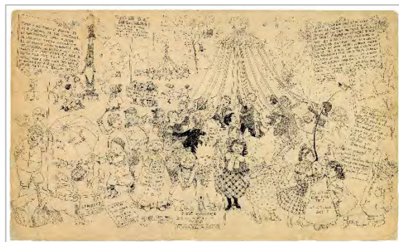
Richard Felton Outcault, The Yellow Kid Ilustración, New York Journal . 20 de septiembre de 1896. Tinta china sobre papel. 9e Art Références, París